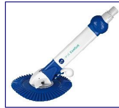
Limpiadores automáticos Puliscifondi automatici