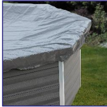
CIKPCO66 Cubierta de invierno Copertura invernale