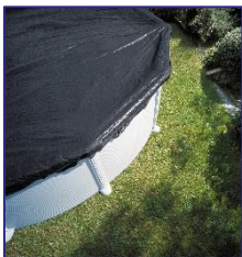
CIPR351 / CIPR351P Cubierta de Invierno Copertura invernale