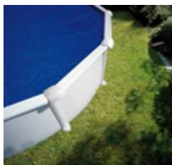
CV350 Cubierta Isotérmica Copertura Isotermica