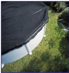
CIPR351 / CIPR351P Cubierta de Invierno Copertura invernale