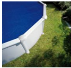
CV350 Cubierta Isotérmica Copertura Isotermica