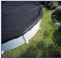
CIPROV611/CIPROV611P Cubierta de Invierno Copertura invernale